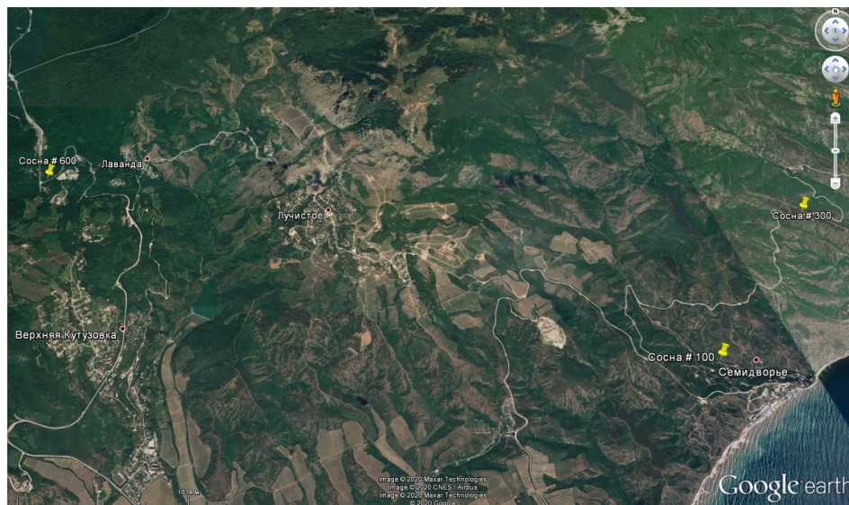
Рис. 1. Схема территориального размещения пробных площадей (ПП).

С использованием материалов космического зондирования спутниковой системы Landsat 8 было определено, что в настоящее время хвойные насаждения на южном макросклоне Главной гряды Крымских гор от Алушты до Судака занимают площадь 2323,5 га, или 21,1 % лесопокрытой территории (11005,7 га) данного района.